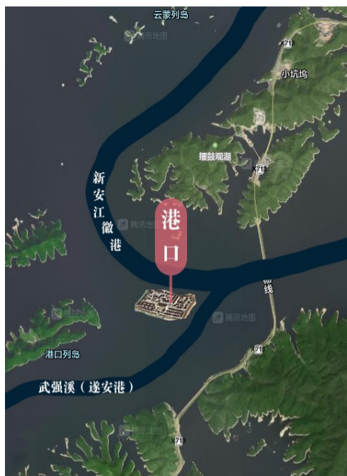
港口镇如今大致在水下的位置

港口镇是新安江中游节点上一颗亮丽的明珠,地处原淳安县城西南约二十里处,有1800多年历史,历来被淳安人民誉为“金港口”。因新安江水电站建设需要,这座古镇被万顷碧波淹没于水下,成为离乡移民永远追忆的一个梦。