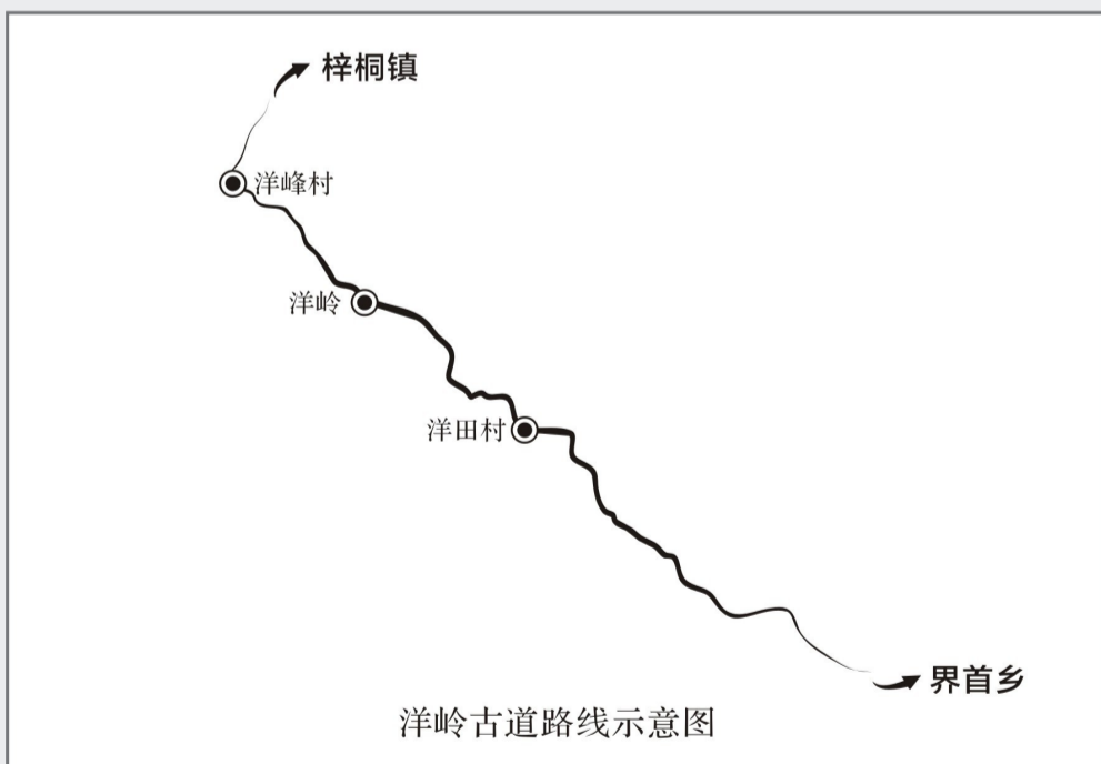
洋岭古道路线示意图

洋岭古道起点界首乡洋田行政村上洋田自然村，终点梓桐镇杜井行政村洋峰自然村，全长3.5千米。古道全程石板路，洋田这边大多以块石砌成，洋峰那边大多以石板铺筑，宽约1.5米，保存状况良好，是淳安县现存古道中维护较好的古道之一。