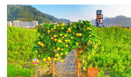
淳安县威坪镇紧邻威坪广场西侧

威坪广场西侧的七彩花海早已经“名声在外”,花园内种植的向日葵、波斯菊、硫华菊、百日草等花卉。各种娇俏可爱的花朵和绿油油的花叶汇成花的海洋,浪漫仙境吸引着市民游客纷至沓来,也成为新人们拍摄婚纱照的景点。