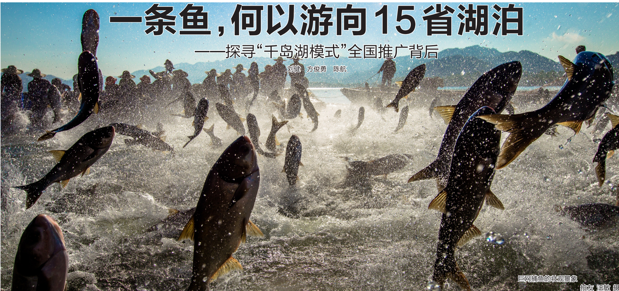
巨网捕鱼壮观景象