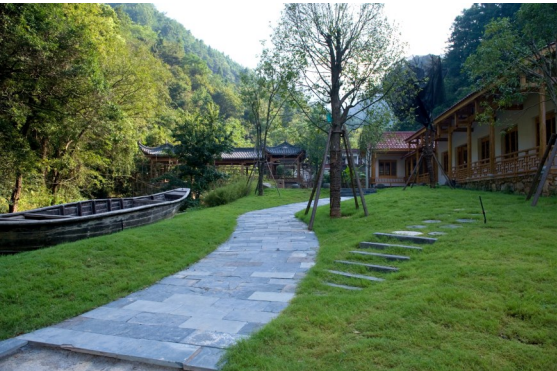
东山尖森林运动公园