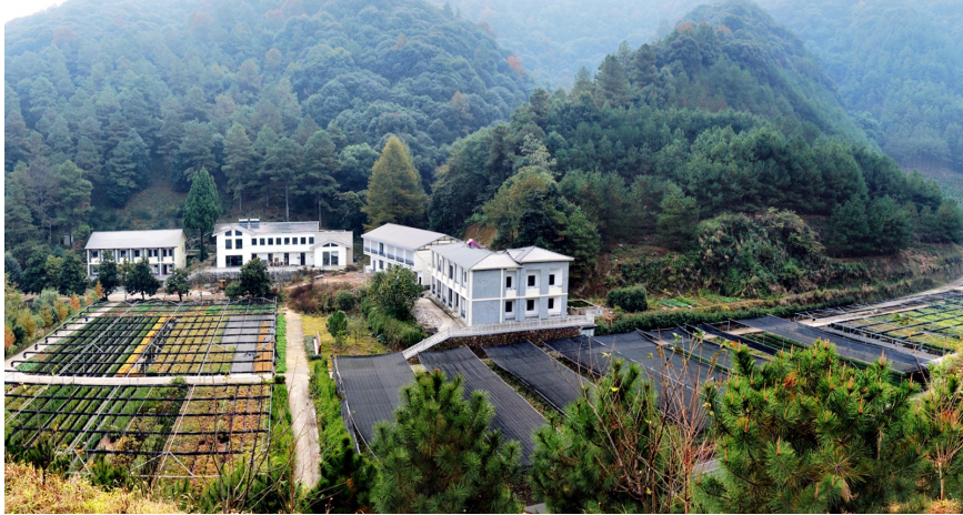
姥山国家级林木良种基地

随着基础设施的日益完善,公司各林场的颜值大幅提升,从功能不齐全的旧屋子摇身成为“高大上”的新场部,全体职工的工作生活环境得到极大改善,每个人的工作热情都愈发昂扬向上,更有获得感和荣誉感。