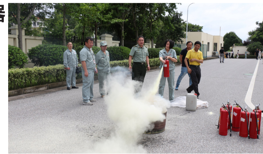
消防官兵们为农夫山泉浙江千岛湖有限公司的150多名员工们上了一堂别开生面的消防安全知识讲座,同时“手把手”教大家掌握了灭火器使用。

别看灭火器平时就在身边,危急关头未必人人都能用得得心应手。消防官兵提醒企业员工,使用