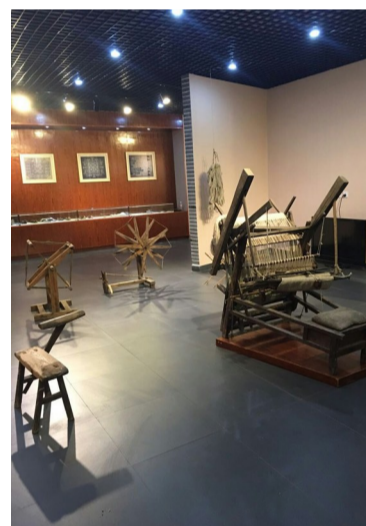
八都麻绣馆

馆内除了有麻绣的传统绣品展示之外,还通过生产织具阵列和图文资料介绍,多方面展示麻绣的独特技艺及文化。十里八乡的父老乡亲每每逢集、逢会,总喜欢来此逛一逛,最热闹时,一天接待上千名参观者。