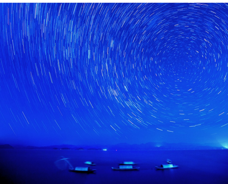
湖畔星空