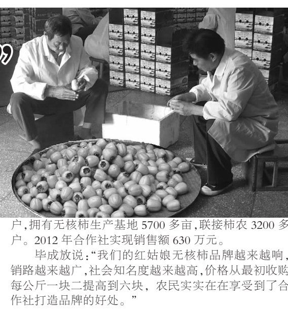
户,拥有无核柿生产基地5700多亩,联接社员3200多户。2012年合作社实现销售额630万元。...